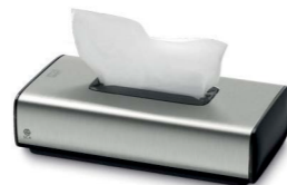
Tork Spender für Kosmetiktücher (F1) Art.-Nr. 460013 Nachfüllmaterial: Tork extra weiche Kosmetiktücher Art.-Nr. 140280