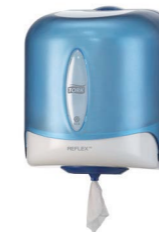
Tork Reflex™ Einzelblatt Innenabrollungsspender (M4) Art.-Nr. 473133 Nachfüllmaterial: Tork Reflex™ Starke Mehrzweck Papierwischtücher Art.-Nr. 473472 1 Rolle ersetzt bis zu 10 Küchenrollen