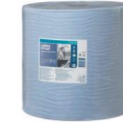
Tork Starke Mehrzweck Papierwischtücher (W1) Art.-Nr. 130050