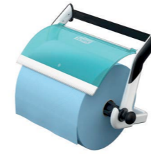
Tork Wandhalter (W1) Art.-Nr. 652100

Hygiene ist eine notwendige Routine in der Profiküche. Doch Sie und Ihr Team stehen unter permanentem Zeitdruck. Sie brauchen Produkte, die so leicht zu bedienen sind, dass jeder Mitarbeiter bis hin zur Aushilfe sicher in seine Arbeitsabläufe einbaut. Genau dafür sind die Systeme von Tork konzipiert. Erleichtern Sie Ihrem Team den Arbeitsalltag und machen Sie dabei Ihren Betrieb noch kosteneffizienter.