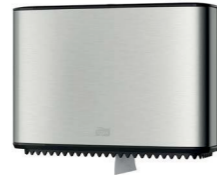
Tork Spender für Mini Jumbo Toilettenpapier (T2) Art.-Nr. 460006

Nachfüllmaterial: Tork luxuriöse Schaumseife (S4) Art.-Nr. 520901