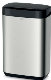
Tork Abfallbehälter (B1), 50 Ltr. Art.-Nr. 460011 Nachfüllmaterial: Tork Abfallsäcke transparent Art.-Nr. 204060

Nachfüllmaterial: Tork weiches Mini Jumbo Toilettenpapier Art.-Nr. 110253