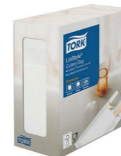
Tork LinStyle® Bestecktaschen weiß Art.-Nr. 477227