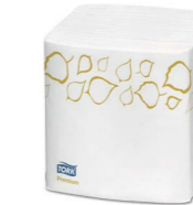
Tork Xpressnap Snack™ Extra Soft Blätterdesign Weiße Spenderserviette (N10) Art.-Nr. 13671