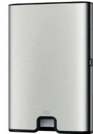
Tork Xpress® Spender für Multifold Handtücher (H2) Art.-Nr. 460004

Nachfüllmaterial: Tork Matic® weiches Rollenhandtuch Art.-Nr. 290016