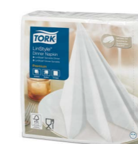
Tork LinStyle® Dinerservietten weiß – 1/4 Falz Art.-Nr. 478711