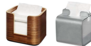
Tork Xpressnap Snack™ Tischspender (N10) Art.-Nr. Walnuss 273003 Art.-Nr. Aluminium 274003

Um Ihre Gäste zu begeistern, reicht es nicht aus, nur einen zufriedenstellenden Service zu bieten – es geht vielmehr darum, immer das perfekte Erlebnis zu schaffen. Egal ob im Restaurant, in den Meetingräumen oder in der Lobby: Die Servietten und die Produkte für den Tisch sind ein zwar kleines, aber doch entscheidendes Detail für den Gesamteindruck. Unser Sortiment bietet eine breite Auswahl, aus der Sie genau das wählen können, was Sie brauchen, um eine einmalige Atmosphäre für Ihre Gäste zu schaffen. Dabei sehen unsere Produkte nicht nur gut aus, sie sind darüber hinaus noch besonders leistungsfähig.