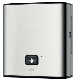
Tork Matic® Sensorspender für Rollenhandtücher (H1) Art.-Nr. 460001

Wenn Sie Ihren Besuchern eine gehobene, komfortable Ausstattung in den öffentlichen Waschräumen und den Gästezimmern anbieten möchten, ist die preisgekrönte Tork Image Design™ Linie aus Edelstahl für Sie interessant. Sie kombiniert stilvolles Design mit Funktionalität: Alle Systeme sind mit zusätzlichen Funktionen ausgestattet, die Ihnen Prozesse erleichtern und viel Zeit im Arbeitsalltag sparen. So zeigt Ihnen z. B. der Rollenhandtuchspender schon von außen, wann eine neue Rolle benötigt wird, und der Abfalleimer kann direkt an die Wand montiert werden, damit die Reinigung einfach und schnell geht.