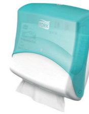
Tork Einzeltuchspender (W4) Art.-Nr. 654000