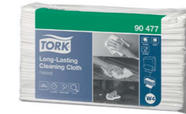
Tork Langlebige Reinigungstücher (W4) Art.-Nr. 90477